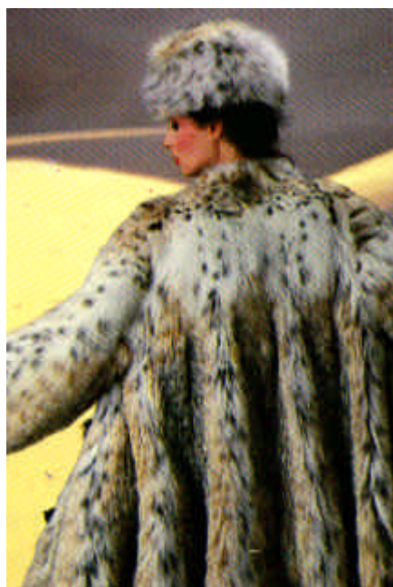
Ce manteau à coûté la vie à 14 lynx, morts atrocement dans des pièges.