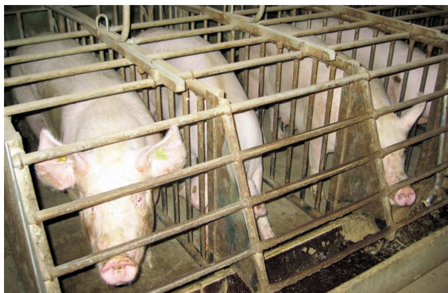
Elevages de porcs et de poules en Suisse