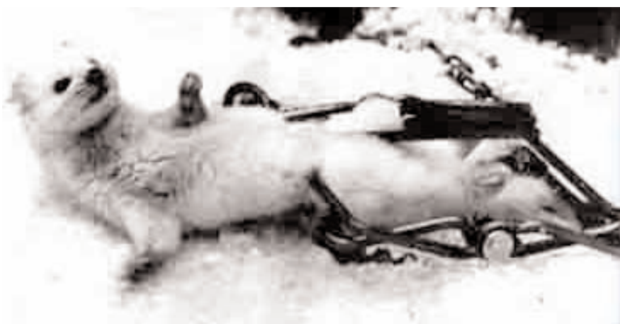
Animaux pour l'industrie de la fourrure

Autre événement à relever: nous recevons régulièrement des invitations de la part d'organisations pour la protection animale à l'occasion de leur repas de fin d'année ou d'une journée «Portes ouvertes». Mais nous sommes à chaque fois tristes de constater que les repas sont carnés! Les amis des animaux protègent donc les uns et avalent les autres! Nous avons fait part de nos griefs à la Présidente de l'association «Animaux Secours» à Arthaz (France) qui, partageant entièrement notre point de vue, nous a priés de prendre en charge la préparation d'un repas végétarien lors de leur journée «Portes ouvertes». Assistés par quelques membres de «Animaux Secours» et après avoir trouvé un sponsor pour financer la «matière première», nous avons pu présenter un buffet végétarien succulent pour le plaisir d'environ 120 convives! Notre recommandation « Manger végétarien pour votre santé et par amour des animaux » a été accueillie avec un très grand enthousiasme!