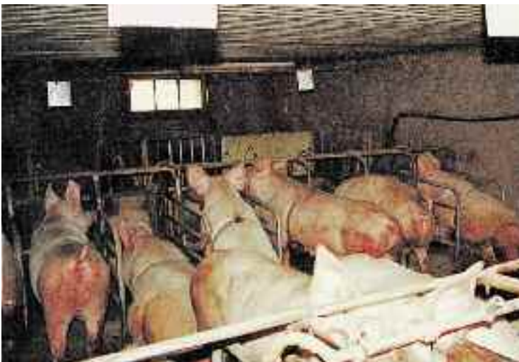
... dans laquelle tous les principes de la protection des animaux sont violés.