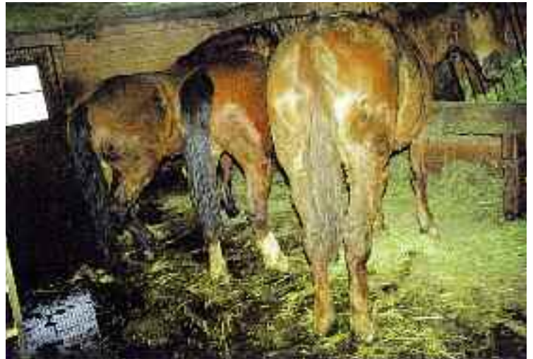
L'écurie de M Davet, Chavannes-les-Forts. Les chevaux sont attachés par des chaînes et obligés de se coucher dans la saleté...