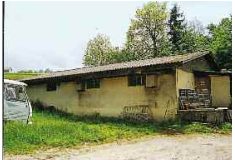
Encore une étable de M Juriens à Ursy...