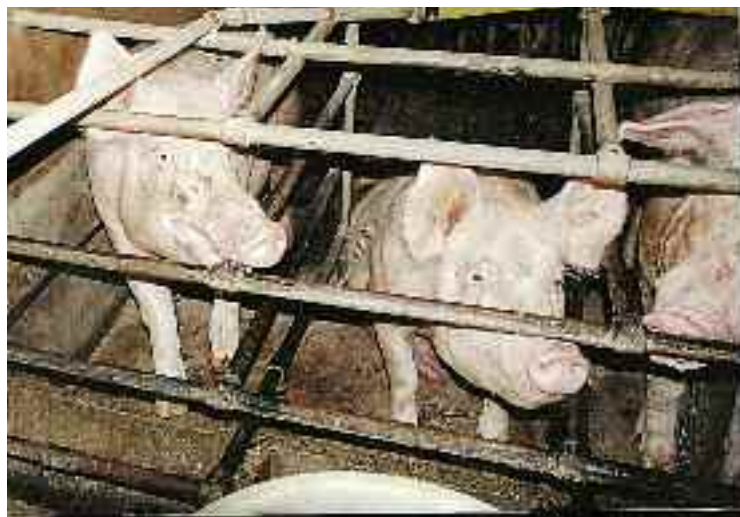
... sans la possibilité de s'occuper comme prescrit par l'ordonnance sur la protection des animaux.