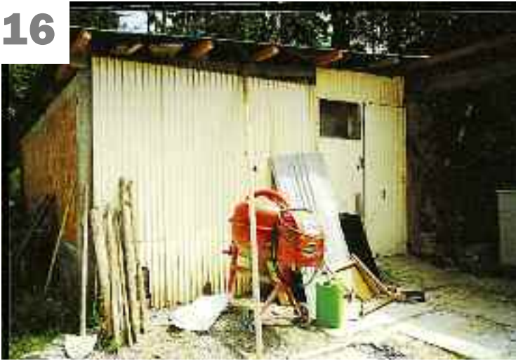
«Etable» de M Juriens à Ursy: Truies fixées par des sangles dans des stalles étroites, sur le sol dur sans litière et ...